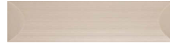
36708 LOG TAUPE/12,5X50 H45 (12,5x50 cm — 4 15 / 16 x19 11 / 16 "*) ** 44 Kerakoll