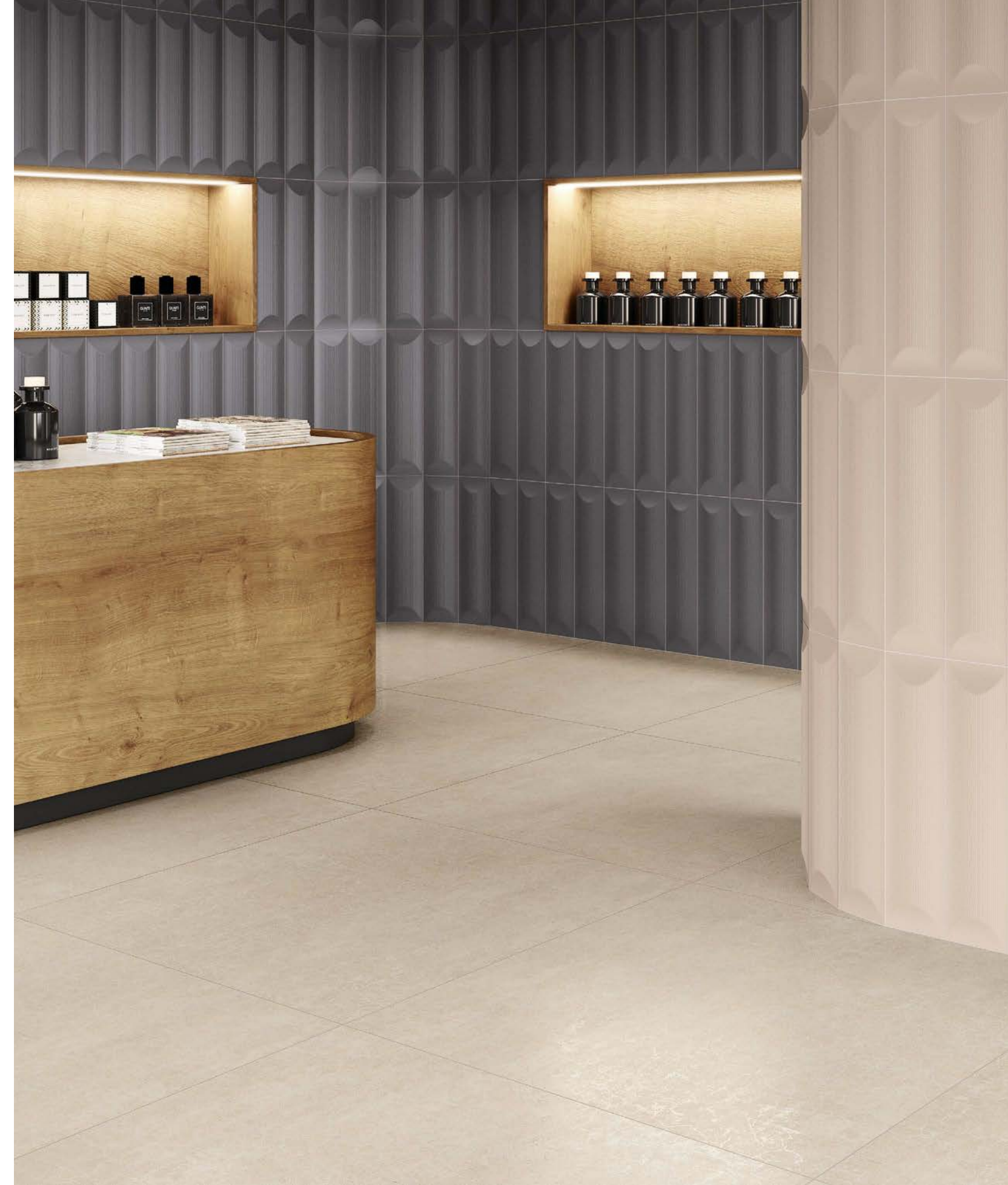
● LOG TAUPE/12,5X50 · LOG ANTHRACITE/12,5X50