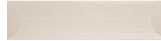
36706 LOG SAND/12,5X50 H45 (12,5x50 cm — 4 15 / 16 x19 11 / 16 "*) ** 43 Kerakoll