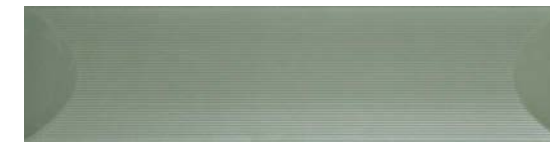
36709 LOG GREEN/12,5X50 H45 (12,5x50 cm — 4 15 / 16 x19 11 / 16 "*) ** 19 Kerakoll