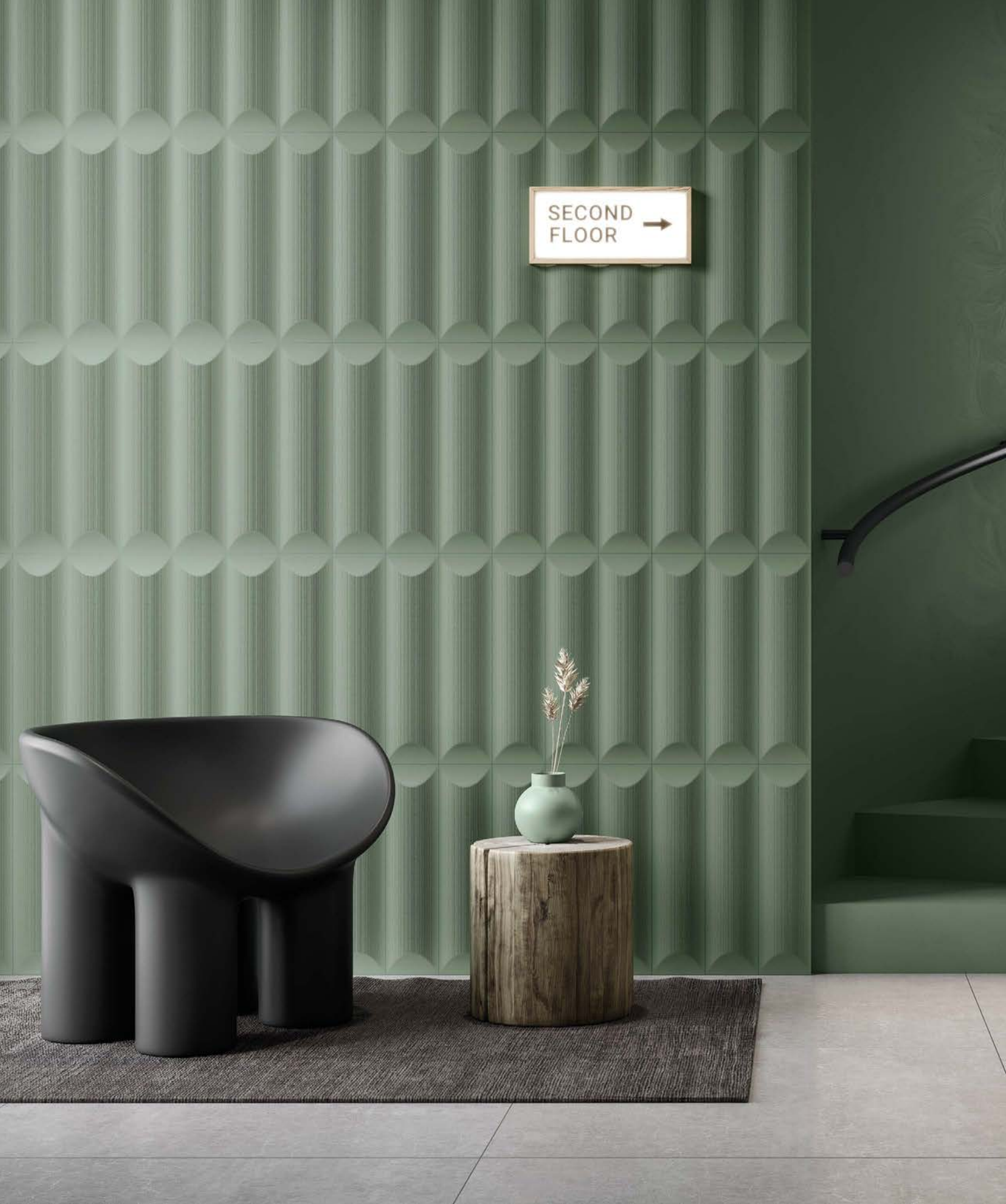
● LOG GREEN/12,5X50